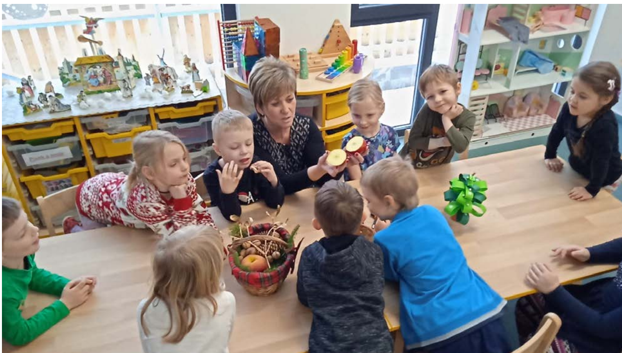
Paní učitelky ze žluté třídy